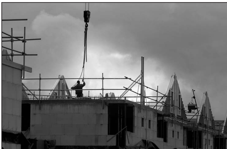
Welk type woningen worden in Apeldoorn gebouwd?

Momenteel wordt er met name gebouwd in Osseveld-Oost, aan de noordzijde van het station (rond de Molenstraat), op het terrein van de voormalige Van Haectenkazerne, aan de Sterrenlaan en in Welgelegen. Daarna is er nog ruimte voor uitbreiding in Zonnehoeve (achter Groot Schuilenburg) en in Zuidbroek. Verder zal er dan gebouwd gaan worden op De Vlijt, nadat een aantal bedrijven die daar nu nog gevestigd zijn, verplaatst zullen zijn naar bedrijventerreinen buiten de stad. Ook in de dorpen zal er op beperkte schaal gebouwd kunnen worden. ■