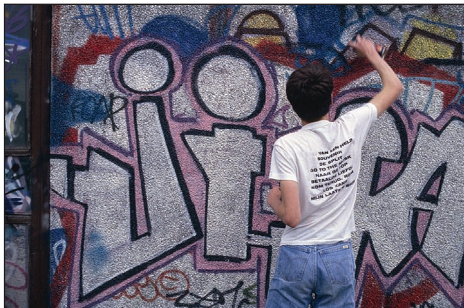
In Apeldoorn doen zich regelmatig problemen voor bij de openbare orde.