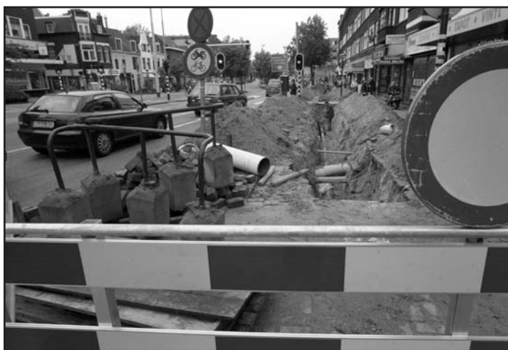
Op veel plaatsen overlast in de binnenstad van Apeldoorn.

bedoeling dat er vanuit de binnenstad negen van zulke 'snelwegen' voor de fietser komen. Naar alle buitenwijken één. Op deze doorstroommassen moet de fietser door kunnen rijden op een comfortabel fietspad, en voorrang krijgen van de auto. Doel van de aanleg van deze doorstroomassen is om te bevorderen dat de Apeldoorners voor verplaatsingen binnen de bebouwde kom hun auto laten staan, en in plaats daarvan de fiets nemen. Dat geeft minder files en spaart het milieu. Een beleid waar wij, als SGP, van harte achterstaan. ■