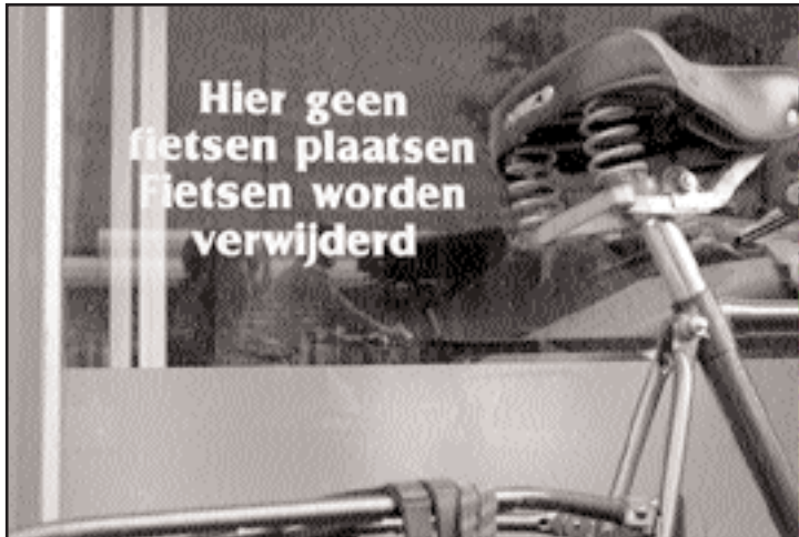
Regels zijn er niet om overtreden te worden.

winkelcentra en dergelijke). Allereerst dient de gemeente te zorgen voor het handhaven van de openbare orde, maar daarnaast kan door het steunen van bepaalde projecten worden geprobeerd het gedrag van mensen te veranderen. Ze worden dan geleerd dat ze anders met elkaar moeten omgaan. Er lopen al projecten zoals bromscooter cursussen, waarin verkeersveiligheid en gedrag in het verkeer centraal staan, en het huiskamerproject in Zevenhuizen waar bewoners met elkaar afspraken maken over gedrag wat ze acceptabel vinden. De SGP is een