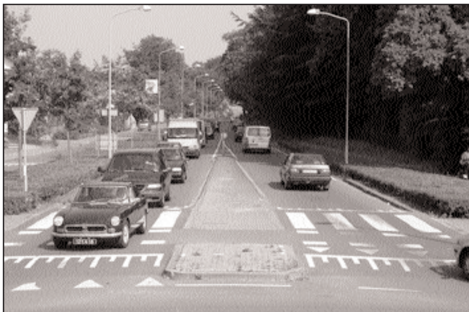
De Zutphensestraat moet volgens plannen van het college vierbaans worden.

variant 1 iets aan te passen, zodat de pijn voor de omwonenden van de Zutphensestraat wordt verzacht. Kuijpers wil een minder brede middenberm, zodat er minder bomen hoeven te worden gekapt, een verdiepte aanleg van de vierbaansweg, geluidsarm asfalt en een laag geluidsscherm. Gezien het verloop van de discussie op 5 juni lijkt hiervoor in de gemeenteraadvergadering van 26 juni wel een meerderheid te zijn. De wijkraad Osseveld-Woudhuis heeft echter al aangegeven aan geen enkele vorm van variant 1 te willen meewerken. Voor onze fractie verzachten bovengenoemde aanpassingen wel een deel van de pijn, maar variant 1 wordt er wel weer duurder door, zodat het finan-