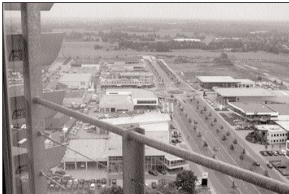
Een blik op de locatie van de nieuwe wijk Zuidbroek.

Onze woordvoerder, Hans Leune, had gevraagd waarom de weg niet gewoon om de Polkastraat heen gelegd zou kunnen worden (daar is nu nog weiland). Het college kwam met allerlei argumenten: de Gavottestraat zou de meest rechtstreekse verbinding zijn, en zou beter aansluiten op de wegen in het