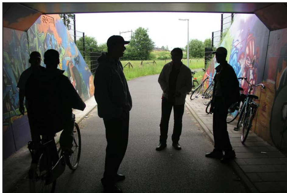
Jongeren kunnen soms urenlang doelloos rondhangen.