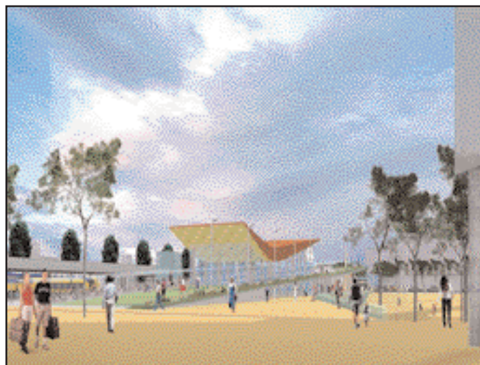
Illustratie van het nieuwe station

Het opknappen van het stationsgebied is een project van meer dan 200 miljoen euro. Er komen tal van nieuwe gebouwen. Om de veiligheid te verbeteren wil de gemeente een fietstunnel onder het spoor aanleggen. De oversteekplaats zoals die nu is (spoor en weg) geldt als een van de onveiligste plekken van Gelderland. De bouw van de nieuwe tunnel hangt grotendeels af van de beslis-