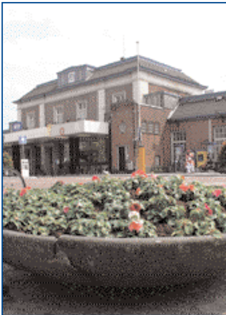
Het oude station

gesloopt. Medio mei stelde de commissie voor ruimtelijke kwaliteit (CRK) in een advies dat de gemeente Apeldoorn en NS onderzoek moeten doen naar modellen waarbij naast het huidige station een nieuw station wordt gebouwd. „Het huidige gebouw is van groot belang voor het ervaren van de cultuur-historie van de stad", aldus de CRK. „Met het behoud van het huidige station handhaaf je het collectieve geheugen dat van een stad een stad maakt."