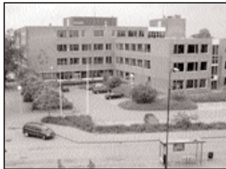
De SGP hecht aan goede kwaliteit van de onderwijshuisvesting.

Apeldoorn experimenteert met het 'brede school'-concept. Op verschillende basisscholen worden kinderen voor en na schooltijd opgevangen. De kinderen krijgen op school bijvoorbeeld extra lessen op het gebied van taal, sport of muziek. Tijdens de behandeling van dit onderwerp in de raadscommissie Maatschappelijke Ontwikkeling van 12 juni was er veel steun voor deze aanpak. De SGP heeft in de discussie naar voren gebracht dat de verantwoordelijkheid voor de opvoeding bij de ouders ligt. De scholen mogen dat niet overnemen. Toch kan een brede school soms nodig zijn als vangnet voor het geval er in bepaalde wijken grote problemen zijn met kinderen. Het gaat daarbij bijvoorbeeld om de bestrijding van taalachterstanden in buurten met veel allochtonen of om een vroegtijdige signalering van opvoedingsproblemen. De SGP heeft daarom gepleit voor maatwerk. De brede school mag niet verworden tot een gemakkelijke opvangplaats van kinderen voor en na schooltijd, omdat ouders 'geen tijd hebben' (tweeverdieners). De nadruk bij de opvoeding dient in het gezin te liggen.